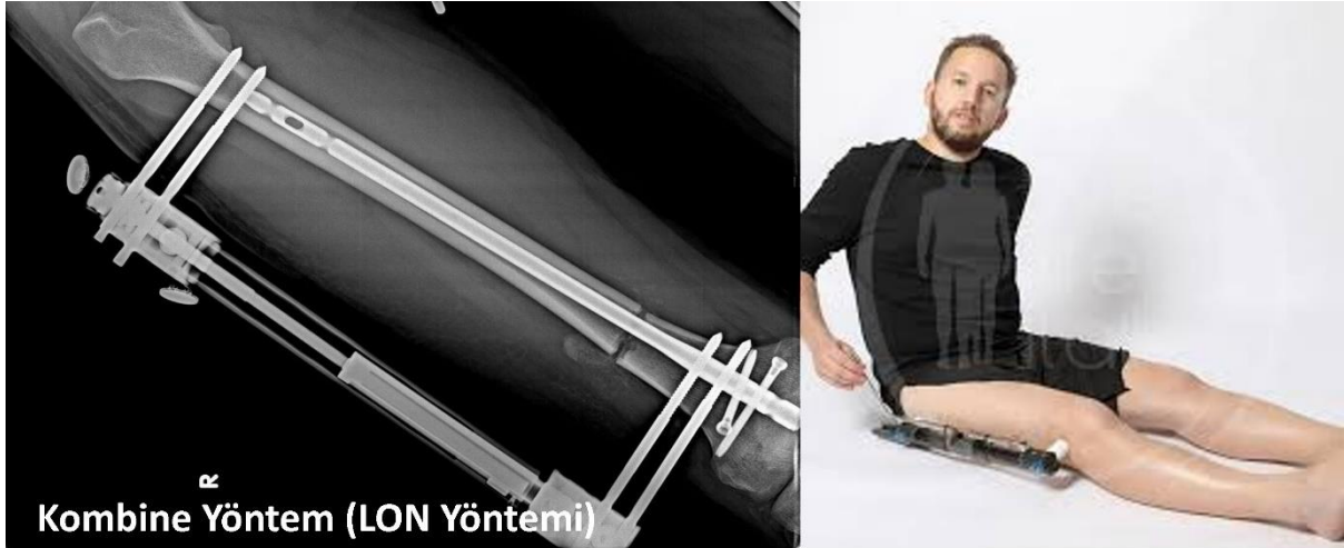
Kombine Yöntem (LON Yöntemi)

Kombinasyon sistemi, hem eksternal fiksator hem de intramedüller (kemik içi) çivi kullanılarak gerçekleştirilen bir yöntemdir. Bu sistemde, öncelikle monolateral (tek taraflı) fiksator veya İlizarov yöntemi ve benzeri bir dış fiksator kullanılarak kemik uzatılır. Uzatma işlemi tamamlandıktan sonra, eksternal fiksator çıkarılır ve yerine intramedüller çivi yerleştirilir. Bu kombinasyon, hem kemik stabilitesini artırır hem de dış fiksator kullanım süresini kısaltır, bu da hastanın konforunu artırır.